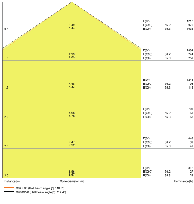
LDC typ cone