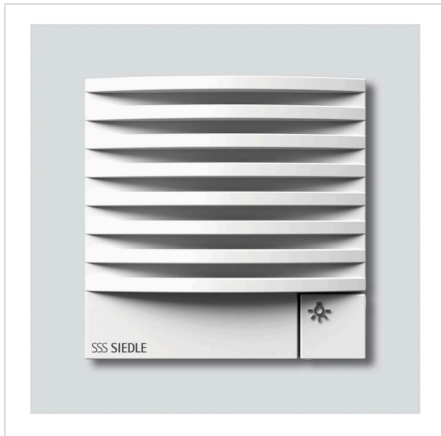
Access Türlautsprecher-Modul ATLM 670-0 W 200041755-00