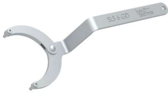
SLS 6G, Gelenkstirnlochschlüssel