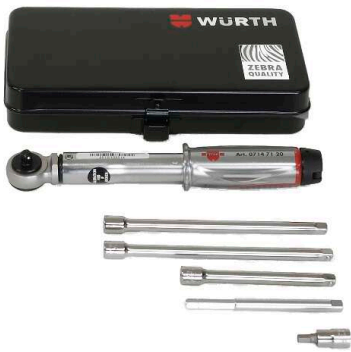
HSI150 DG/HRK SSG WKZ, Werkzeugset für HSI150 DG/HRK SSG