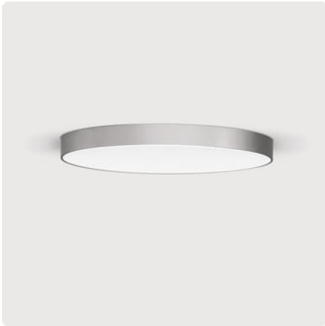
Abbildungen ggf. nur ähnlich, dienen als Orientierung.