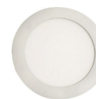
LED Panel Vorderansicht