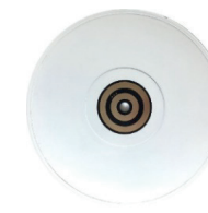
LED Panel Rückansicht