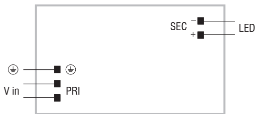
DC 30W 24V SLIM - DC 60W 24V SLIM

(Max. LED distance at page info8 - Massima distanza LED a pagina info8)