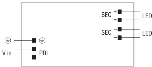
DC 150W 24V SLIM