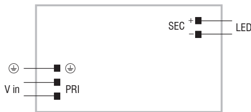
DC 100W 24V SLIM