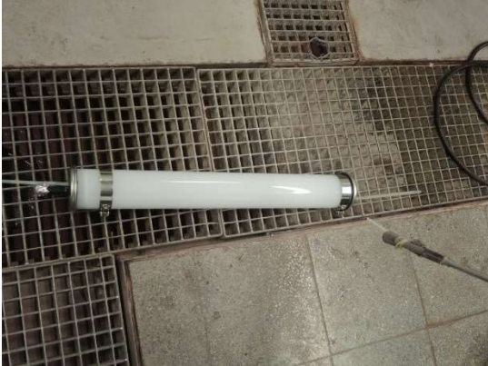
Test setup DUT 13W