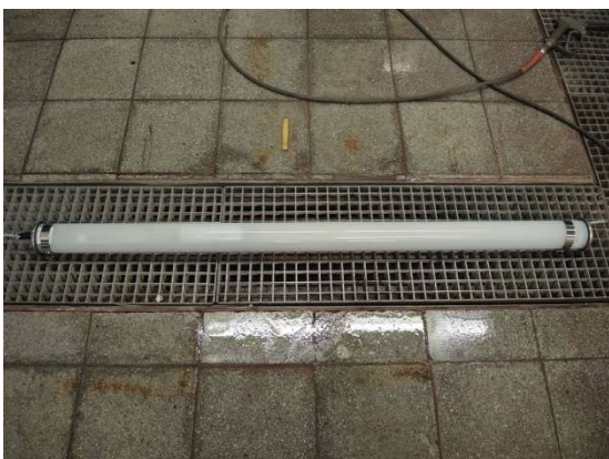
Test setup DUT 32W