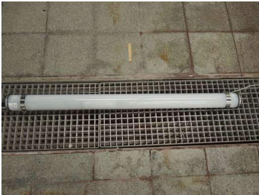
Test setup DUT 26W